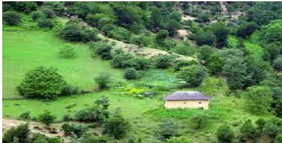
Shanderman est une des parties de la ville de Masal de la province de Gilan comptant 4000 habitants dans une nature généreuse et un climat toujours aussi agréable.