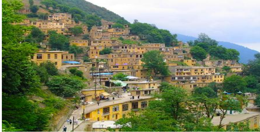
Le district rural de Kasma comprend 36 villages au cœur de la province de Gilan et compte en 2006 16000 habitants dont 4550 familles.